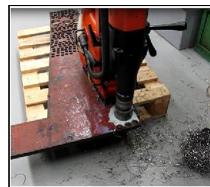
Magfúrás Hardox 400-ba KBM 80 A-val